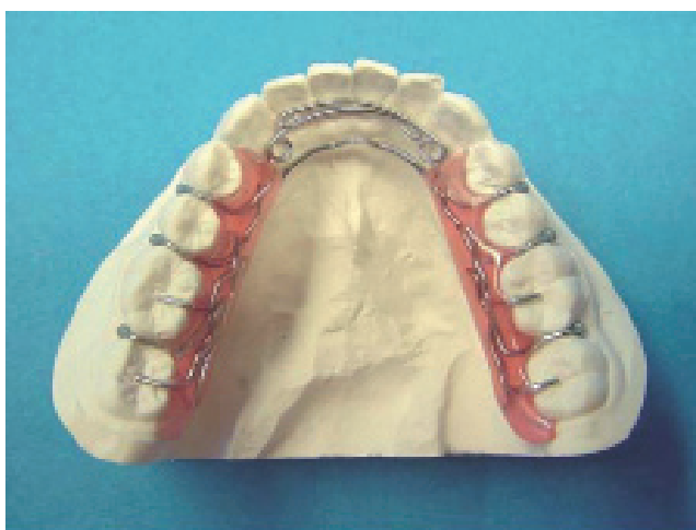
Placca SE finita

Prima di modellare l'arco linguale si devono scaricare con cura tutte le parti che possono creare decubito, l'andamento delle molle deve essere eseguito il più aderente possibile ai denti interessati e l'elice della molla deve essere parallelo alla faccia palatale del canino. Le ritenzioni devono essere eseguite in modo da lasciare lo spazio necessario all'acrilico di inglobare l'arco linguale a non essere troppo esteso lingualmente.