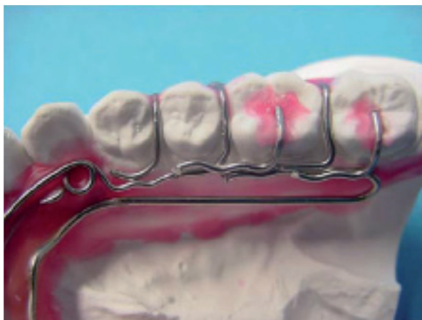
Particolare ancoraggi dx