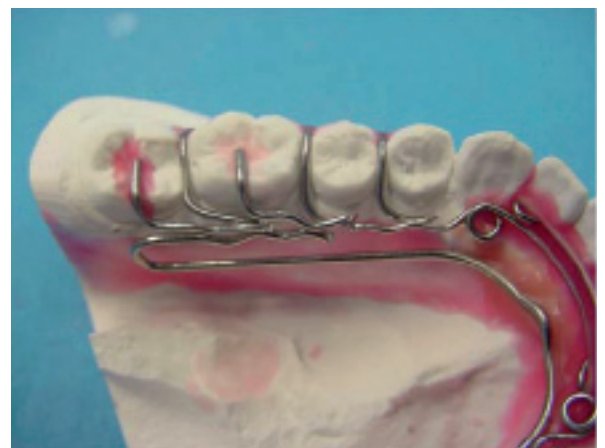
Particolare ancoraggi sx