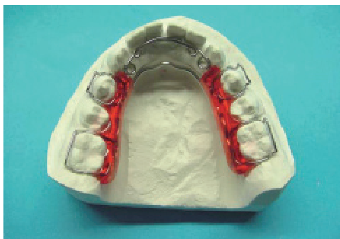
Placca SE finita variante