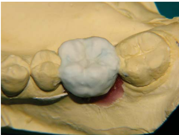
Stratificazione della ceramica Carmen