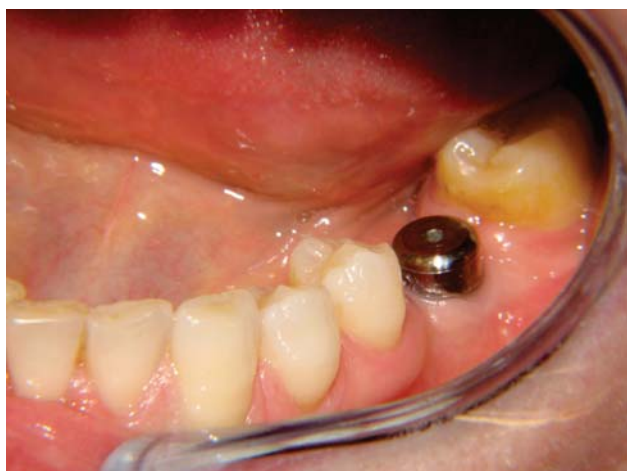
Impianto con vite di guarigione