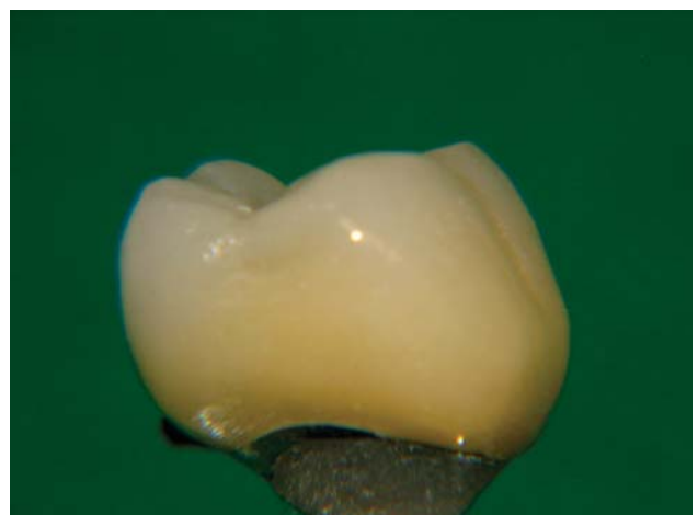
Risultato dopo la cottura