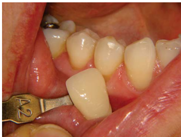
Presca del colore