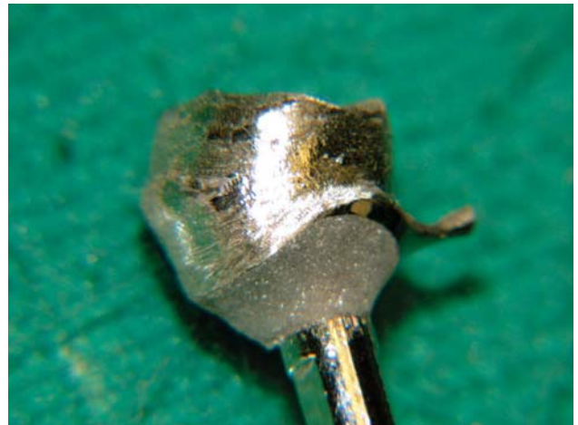
Controllo della precisione marginale